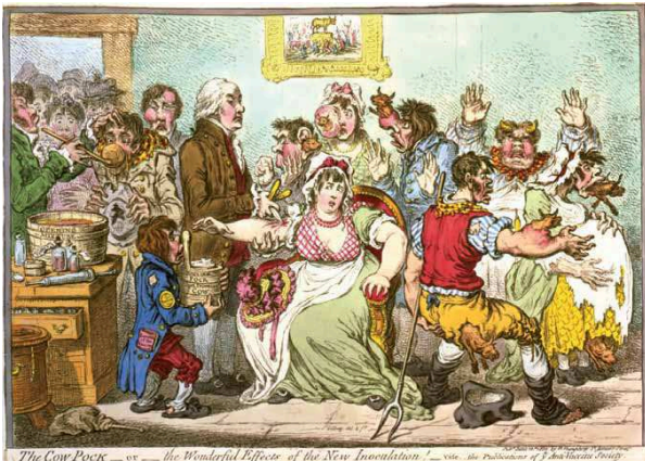
Karikatuur op de koepokinenting, uitgegeven door de Anti Vaccine Society in Engeland. Tekening door James Gillray.

Vanaf het moment dat Reinders zich vestigde als boer, hield hij zich bezig met veeziekten, die in zijn tijd menig boerengezin ruïneerden. Zo stelde hij een middel samen tegen schapenschurft, op basis van menselijke urine, koperrood en tabak waarmee de dieren moesten worden ingewreven. Veepest hield hem het meeste bezig. In de loop van de 18de eeuw hield deze gevreesde veeziekte gruwelijk huis en bracht duizenden boerengezinnen aan de bedelstaf. We weten nu dat het om een uiterst besmettelijk virus ging dat direct of indirect via voorwerpen, voer of menselijke contacten kon worden overgebracht. In de 18de eeuw weet men de ziekte aan kwalijke dampen, wormen of simpelweg aan de straffende hand des Heren. Het beste wat de boeren wisten te doen was het isoleren van zieke dieren, maar meestal had de besmetting dan al plaatsgevonden. De dieren stierven en werden zo snel mogelijk begraven. In weidegebieden in het hele land vinden we nog altijd zulke 'pestbosjes', kleine 'eilandjes'